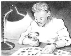
sammle Briefmarken und Comics