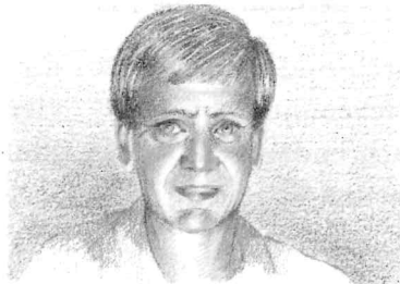
Mein Vater hat braune Haare und blaue Augen. Er spielt sehr gut Klavier.