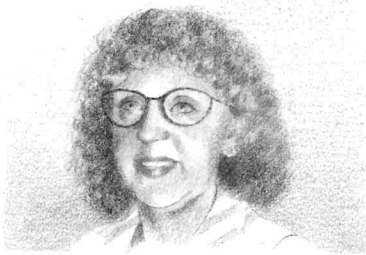
Meine Mutter hat lange, rote Haare und grüne Augen. Sie spielt gern Schach.