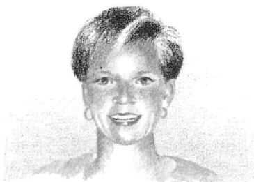
Und meine Kusine Anna ist zweiundzwanzig. Sie hat kurze, schwarze Haare und braune Augen. Sie geht oft wandern.